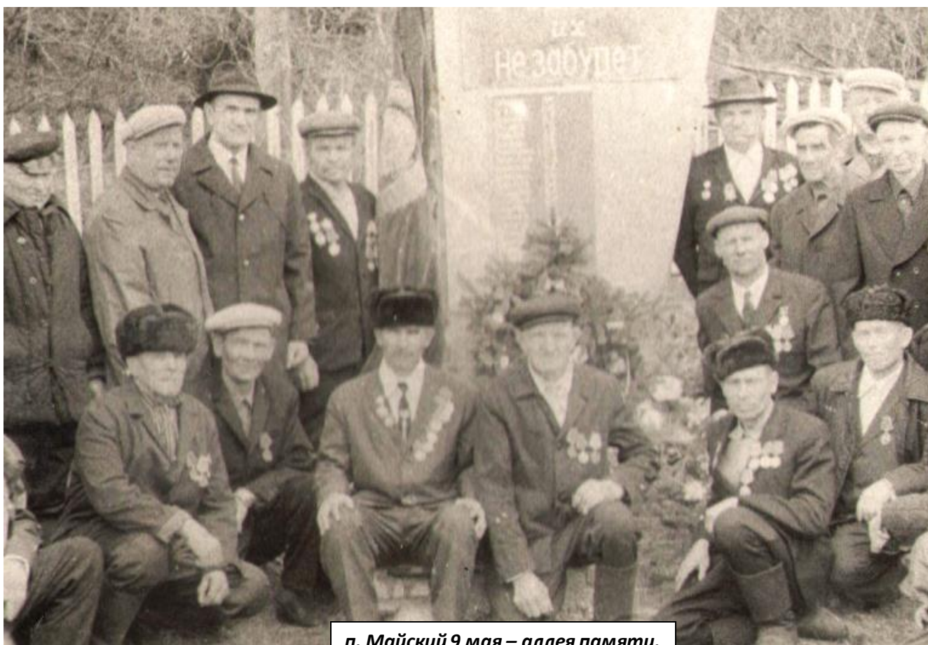
п. Майский 9 мая – аллея памяти. Участники войны 1941-1945 г.г.