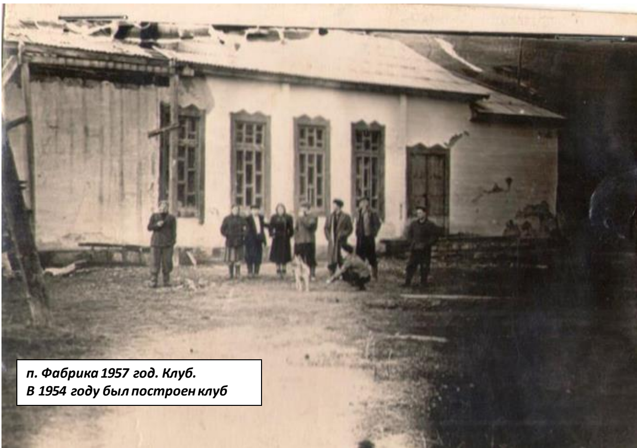
п. Фабрика 1957 год. Клуб. В 1954 году был построен клуб