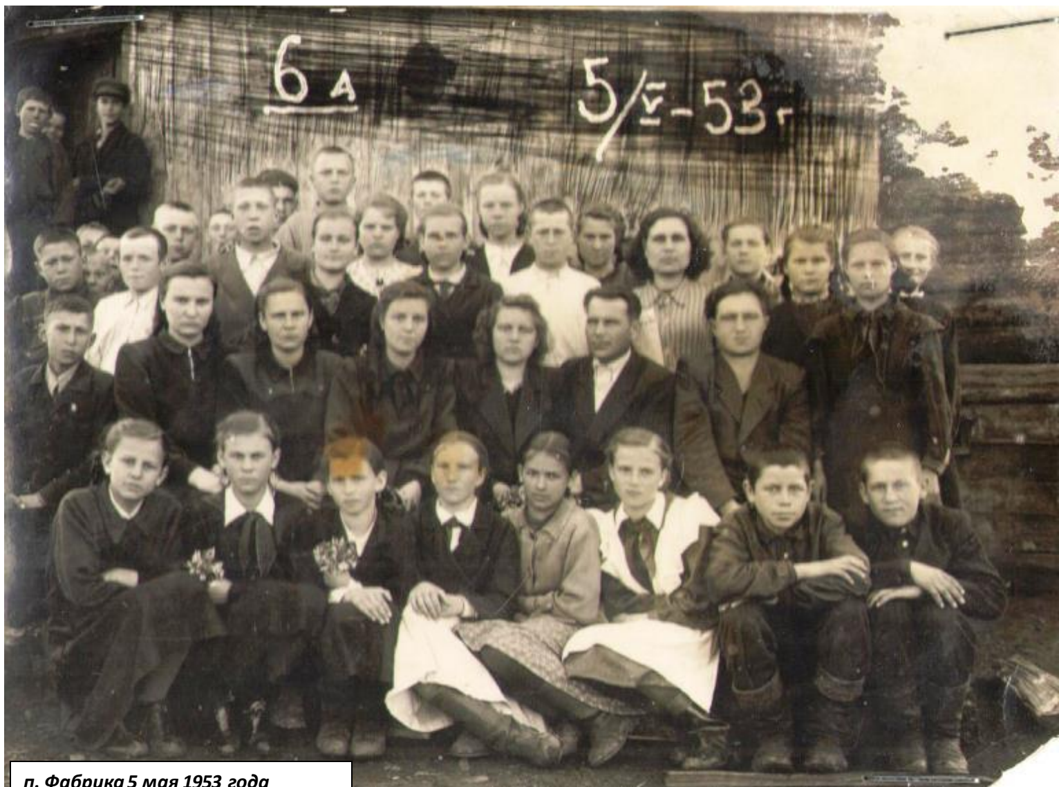
п. Фабрика 5 мая 1953 года ученики 6 «А» класса семилетней школы и все учителя. В 1950 году открылась школа.