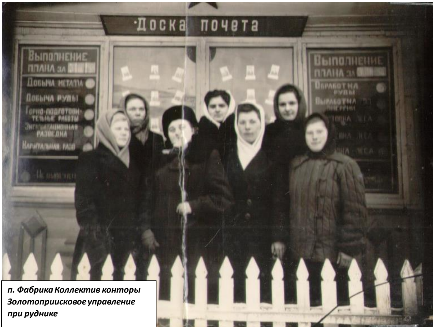
п. Фабрика Коллектив конторы Золотоприисковое управление при руднике