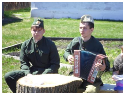
Вечер памяти «Бессмертный полк»