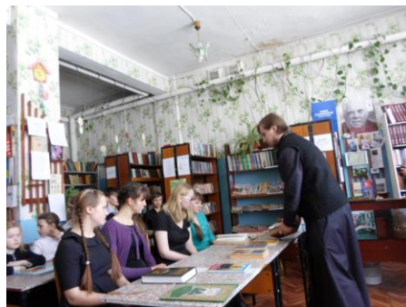
День православной книги «Живое слово мудрости духовной»