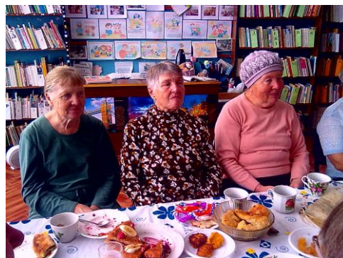
Посиделки «День пирога»