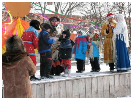
Театрализованное гуляние: «Проводы зимы»