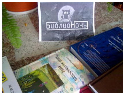
Межрегиональная акция. «Библионочь»