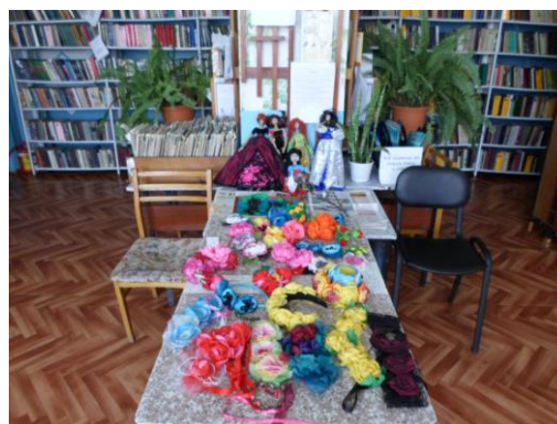
Выставочная работа Олемской Ларисы