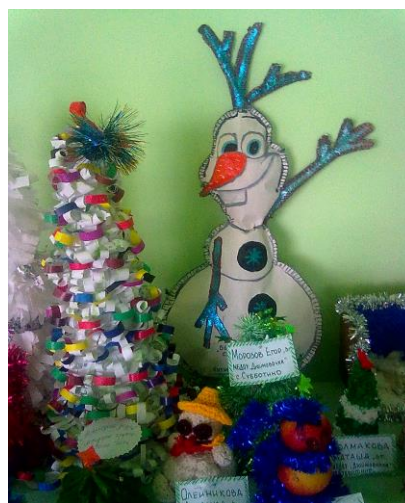
Выставка новогодних поделок