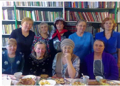
Литературный вечер: «Встречаем вместе старый новый год»