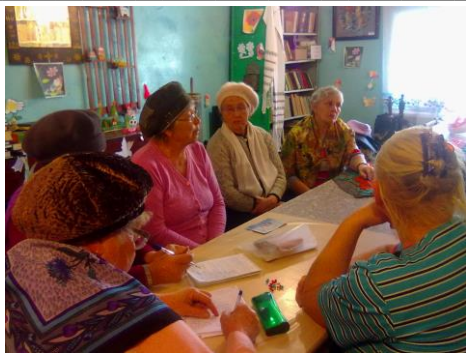
Рождественские посиделки «Свет рождественской звезды»