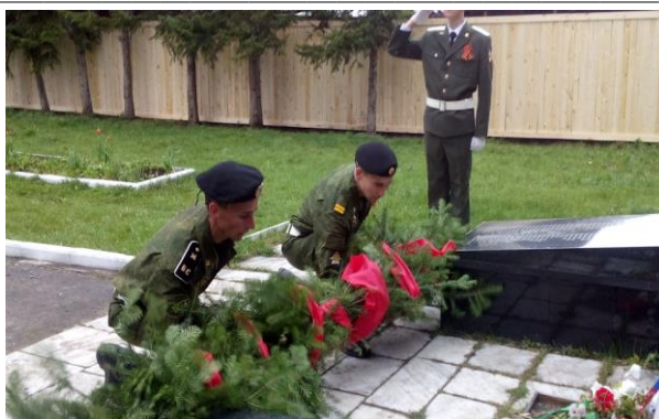
Вахта памяти «Помним всех поимённо»