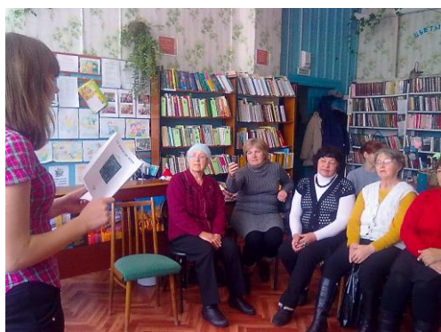
Литературно-поэтический вечер «Мысли вслух»