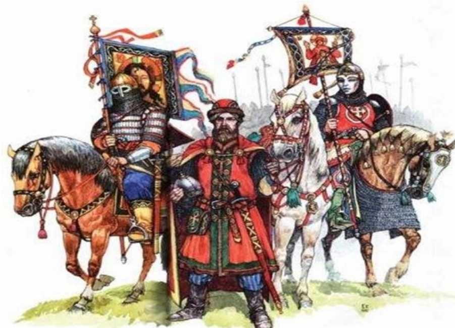
Знамя великий стѣга царя великаго всенароднаго 1560 года.

Он был установлен в 1994 году указом президента Российской Федерации.